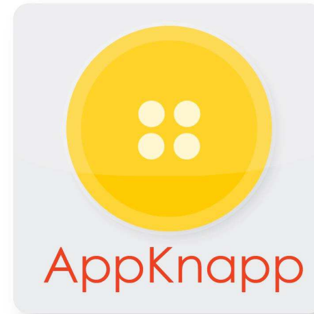
AppKnapp – peka, lek och lär i förskolan