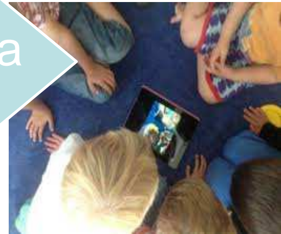
Plattan i mattan – didaktisk design och digitala pekplattor i förskolan